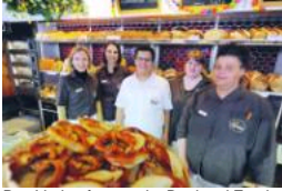
Das Verkaufsteam der Bäckerei Frank in Stuttgart profitierte bereits vom Bildungscoach der Handwerkskammer.