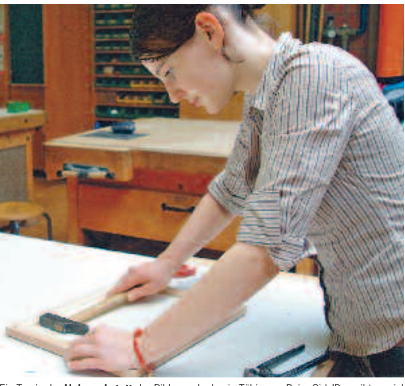
Ein Tag in der Holzwerkstatt der Bildungsakademie Tübingen: Beim Girls' Day gibt es viel zu entdecken.

Interessierte Unternehmen finden unter www.girls-day.de alle Informationen zum bundesweiten Aktionstag. Wer sich beteiligen möchte, kann seine Veranstaltung auf der Homepage anmelden. Die Veranstalter unterstützen kleine und mittlere Betriebe in der Vorbereitung mit Infomaterial und praktischen Anregungen für eine gelungene Veranstaltung im eigenen Unternehmen. Der Girls' Day, Deutschlands größte Berufsorientierungsinitiative, feiert in diesem Jahr sein zehnjähriges Jubiläum. Die Bilanz ist beeindruckend. Rund 900.000 Mädchen haben sich seit dem Start im Jahr 2001 über „typische Männerberufe“ informiert und praktische Erfahrungen in Betrieben gesammelt. Denn beim Girls' Day ist vor allem Mitmachen gefragt. Der Mädchen-Zukunftstag wird unterstützt von der Bundesregierung, der Bundesagentur für Arbeit, Arbeitgeberverbänden und Gewerkschaften.