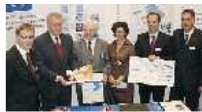
Die Heinz Kurz GmbH Medizintechnik aus Dußlingen produziert Mittelohrimplantate 8