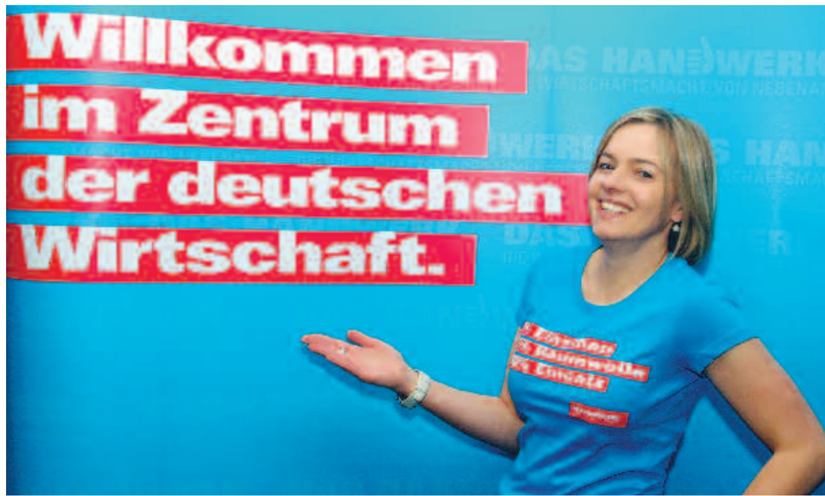
Fünf Prozent Elasthan, 95 Prozent Baumwolle und 100 Prozent Einsatz – die Imagekampagne will mit pffiffigen Sprüchen punkten.

Das Handwerk in Deutschland trumpft mit der Imagekampagne auf