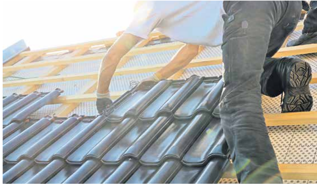
Alle Hände voll zu tun hatten die Bauhandwerker. 87 Prozent der Betriebe beurteilten die Geschäftslage als „gut“.

Zwei Drittel der Betriebe in den Landkreisen Freudenstadt, Reutlingen, Sigmaringen, Tübingen und Zollernalb bewerteten ihre wirtschaftliche Lage im dritten Quartal als „gut“. Vor zwölf Monaten waren es 76 Prozent. Der Anteil derer, die sich unzufrieden äußerten, liegt nahezu unverändert bei rund fünf Prozent. Ebenfalls stabil geblieben ist der Auftragsbestand der Betriebe. Rund neun Wochen sind es im Durchschnitt aller Gewerke. Allerdings sind im Sommer weniger Neueingänge als im Vorjahr hinzugekommen. Jeder vierte Betrieb konnte mehr Bestellungen und Abschlüsse verzeichnen (Vorjahr: 31 Prozent). Einen Rückgang