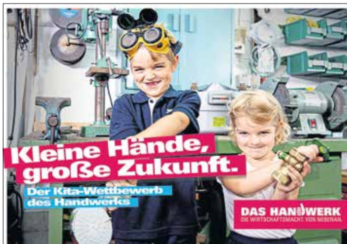
Kindergartenkinder für das Handwerk begeistern.

Die Idee hinter dem Wettbewerb ist so einfach wie überzeugend: Unter dem Motto „Kleine Hände, große Zukunft“ besuchen Kita-Kinder mit ihren Erzieherinnen und Erziehern Handwerksbetriebe in der Region und lernen dabei die faszinierende Vielfalt des Handwerks kennen. Anschließend stellen die Kinder gemeinsam ein Riesenposter her, auf dem sie ihre Erlebnisse und Eindrücke kreativ ausgestalten. Bis zum 7. Februar 2020 können die Kita-Gruppen ihr