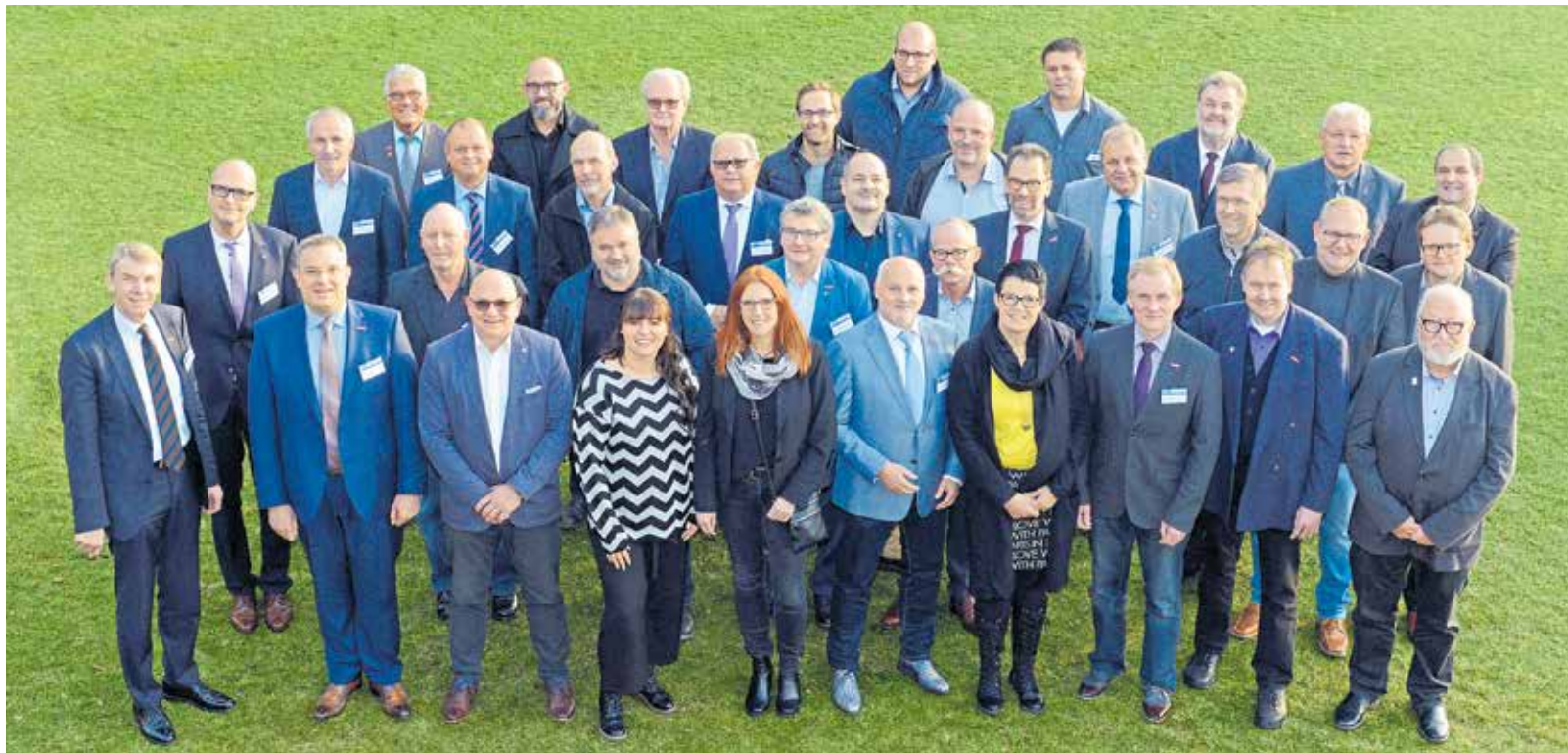
Die Vollversammlung der Handwerkskammer Reutlingen.