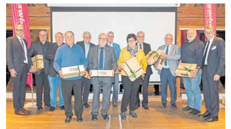
Präsident und Hauptgeschäftsführer dankten den ausscheidenden Mitgliedern für die geleistete Arbeit.