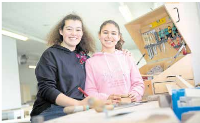
Der Girls' Day und der Boys' Day werden von einem Aktionsbündnis, bestehend aus dem Bundesministerium für Bildung und Forschung, den Spitzenverbänden der deutschen Wirtschaft und dem Deutschen Gewerkschaftsbund, dem Bundeselternrat, getragen und unterstützt.