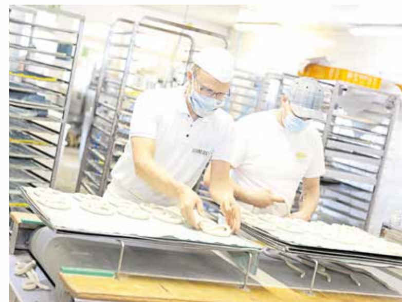
Wer Mitarbeitern medizinische Masken am Arbeitsplatz zur Verfügung stellt, kann die Kosten dafür steuerlich geltend machen.

Als Arbeitgeber sollten Sie Ihre Mitarbeiter schriftlich über die Maskenpflicht informieren. Sie sollten wis-