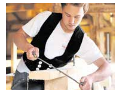
Die Ausbildungsstatistik 2023 liefert einen interessanten Einblick in die Ausbildungssituation im Kammerbezirk.

Download unter www.hwk-reutlingen.de/ausbildungsstatistik , Bestellung unter Tel. 07121/2312-121