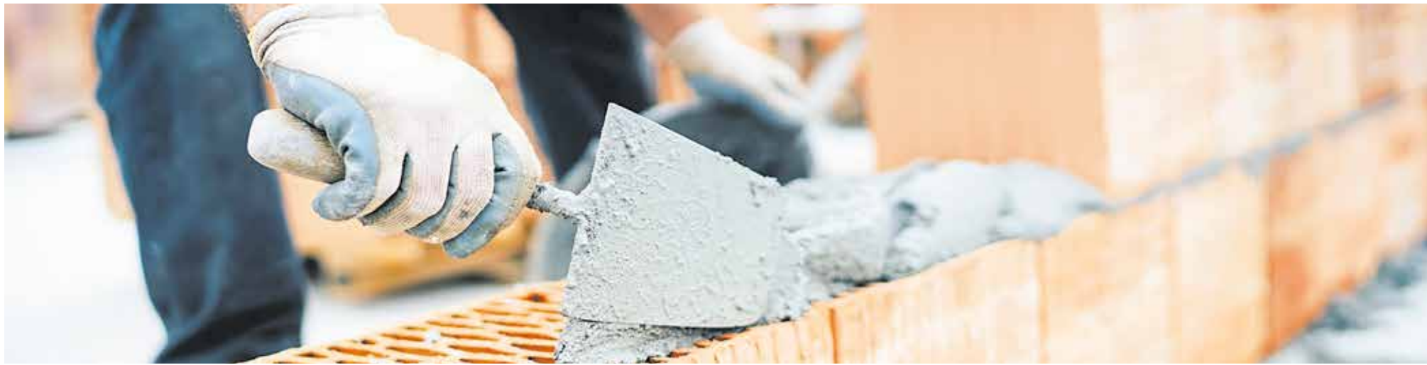
Jeder zweite Baubetrieb musste im ersten Quartal Umsatzeinbußen hinnehmen.