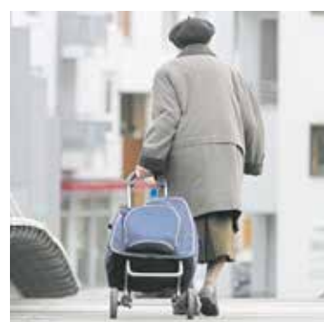
Jede fünfte Frau in Baden-Württemberg ab 65 Jahren ist armutsgefährdet.

Die Analyse zeigt außerdem, dass der Familienstand und die Lebensform eine wichtige Rolle spielen. Im Alter in einer Ehe oder einer Lebensgemeinschaft zu leben, wirkt armutsvermeidend, alleine zu leben hingegen erhöht das Risiko. Diese Situation verschärft sich gerade für Frauen dadurch, dass mehr Frauen als Männer im Alter geschieden, verwitwet oder alleinstehend sind. Insbesondere geschiedene Frauen haben ein hohes Armutsgefährdungsrisiko (37 Prozent). Wer von Altersarmut betroffen ist, leidet beispielsweise häufiger unter Depressionen und fühlt sich eher einsam und sozial ausgegrenzt. Die Analysen zeigen aber auch, dass der Internetzugang und das Wissen um soziale Dienstleistungen am Wohnort das Gefühl sozialer Ausgrenzung Älterer verringern können. Das bietet Anknüpfungspunkte für die Verbesserung der Teilhabe und Lebensqualität Betroffener.