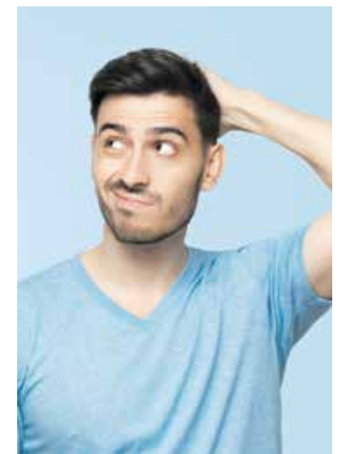
Jeder zehnte Beschäftigte meldet sich schon mal krank, obwohl er arbeitsfähig ist.

Sechs von zehn Beschäftigten melden sich des Öfters bei ihrem Arbeitgeber krank, obwohl sie eigentlich fit sind. Das ergab eine repräsentative Umfrage im Auftrag der Krankenkasse BKK. Von 1.204 Befragten gaben zehn Prozent an, dies häufiger zu tun, bei 23 Prozent kommt es manchmal vor, bei 26 Prozent selten. Auch das Gegenteil einer vorgetäuschten Arbeitsunfähigkeit, wenn Arbeitnehmerinnen und Arbeitnehmer trotz eines leichten Infekts zur Arbeit gehen, wurde unter die Lupe genommen. Hier ist in den vergangenen Jahren – wohl den Erfahrungen der Corona-Pandemie geschuldet – eine Verhaltensänderung zu beobachten. Noch im Jahr 2018 ließ sich die Hälfte der Befragten nicht von einer leichten Erkältung abhalten, zur Arbeit zu kommen. Im Jahr 2023 meldete sich die Mehrzahl in solchen Fällen krank und kurierte sich lieber aus.