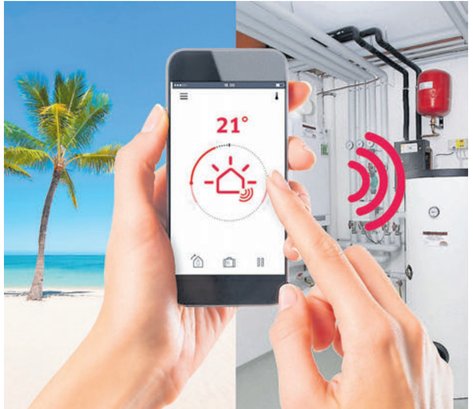
Dank Digitalisierung ist eine komfortable Heizungssteuerung auch von unterwegs aus möglich, etwa aus dem Urlaub. Im Falle einer Störung geht die Information dann direkt auch an den Fachhandwerker.

In bewährter Weise können jedoch Notdienste über die Kreishandwerkerschaften erfragt werden.