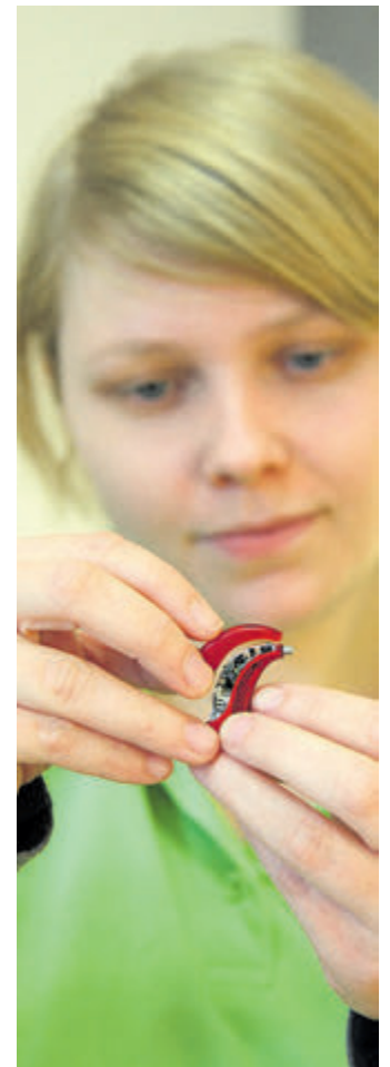
Ganz Ohr für die Bedürfnisse ihrer Kunden: Hörakustiker sind Techniker, Handwerker und Berater zugleich. Der Ausbildungsberuf aus dem Gesundheitshandwerk ist ebenso abwechslungsreich wie zukunftsfähig.

Anzeigen: Wolfgang Dieter Datenschutzbeauftragter: datenschutz@tagblatt.de