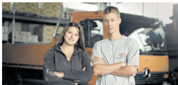
Reinklicken: Auszubildende zeigen ihren Ausbildungsalltag.