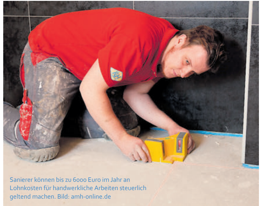
Sanierer können bis zu 6000 Euro im Jahr an Lohnkosten für handwerkliche Arbeiten steuerlich geltend machen.

Noch ein Tipp: Barzahler bleiben auf ihrer Handwerkerrechnung sitzen. Das Fi-