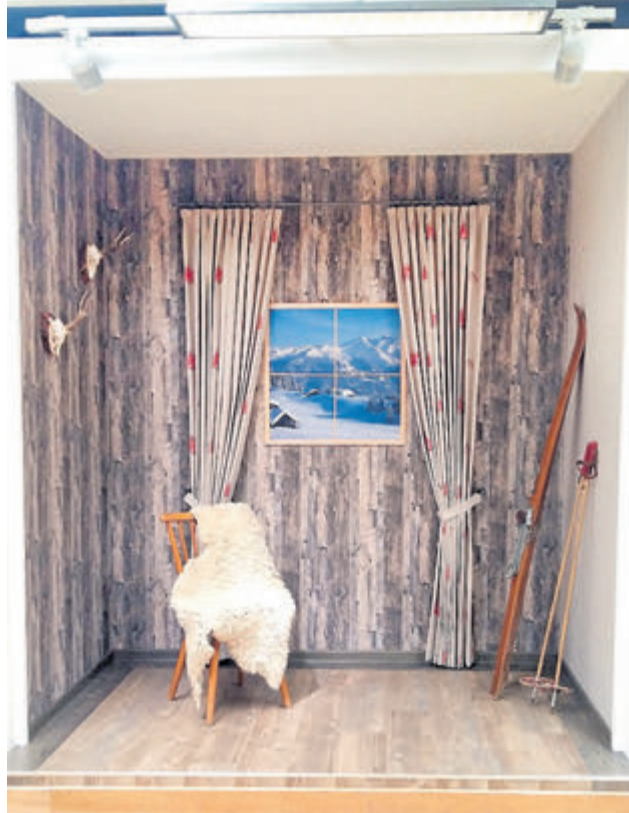
Die „Skihütte“ – das prämierte Gesellenstück von Samuel Knorr. Auf rund vier Quadratmeter galt es, einen Raum zu gestalten, mit Bodenbelag, Tapeten und selbstgenähten Vorhängen.

Weitere Informationen zur Ausbildung unter www.handwerk.de/berufsprofile/raumausstatter-in