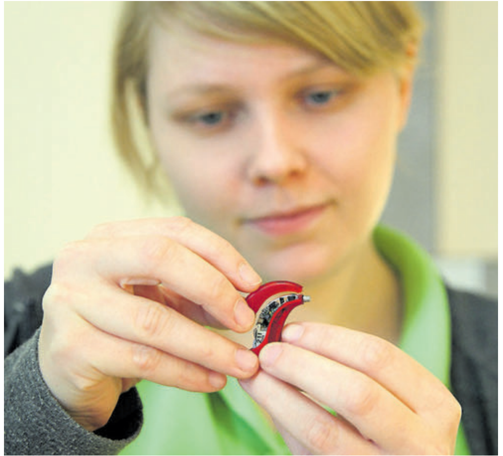
Ganz Ohr für die Bedürfnisse ihrer Kunden: Hörakustiker sind Techniker, Handwerker und Berater zugleich. Der Ausbildungsberuf aus dem Gesundheitshandwerk ist ebenso abwechslungsreich wie zukunftsfähig.