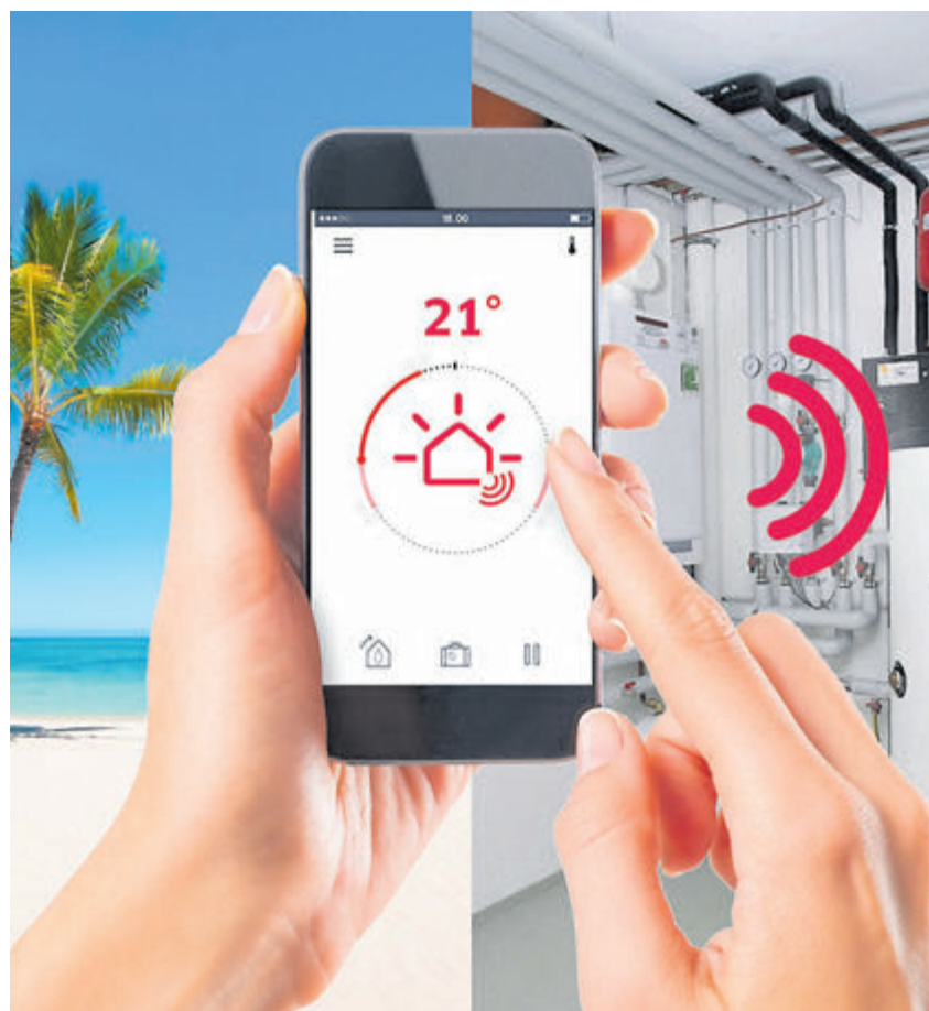
Dank Digitalisierung ist eine komfortable Heizungssteuerung auch von unterwegs aus möglich, etwa aus dem Urlaub. Im Falle einer Störung geht die Information dann direkt auch an den Fachhandwerker.

Mehr Informationen zur Digitalisierung der Heizungstechnik unter www.wasserwaermeluft.de .