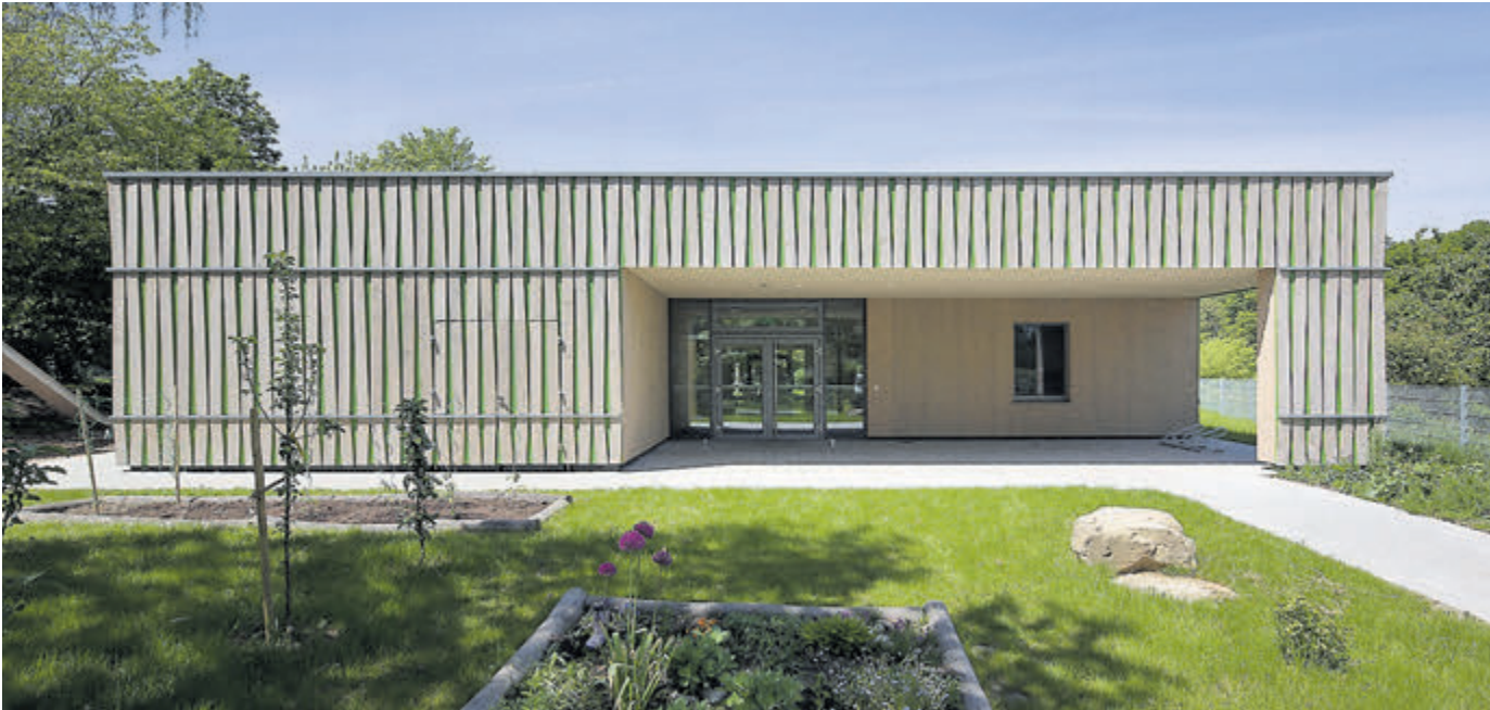
Im Rahmen der Verleihung des Holzbaupreises 2018 wurde das Kinderhaus Tübingen-Hagelloch von der Jury als beispielhaft gewürdigt.