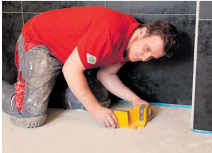
Sanierer können bis zu 6000 Euro im Jahr an Lohnkosten für handwerkliche Arbeiten steuerlich geltend machen.

Kreishandwerkerschaft Sigmaringen Hintere Landesbahnstraße 7 72488 Sigmaringen Telefon (0 75 71) 1 27 27 info@handwerk-sig.de www.handwerk-sig.de