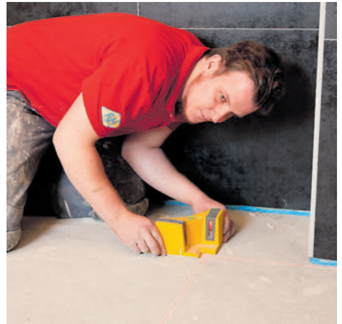
Sanierer können bis zu 6000 Euro im Jahr an Lohnkosten für handwerkliche Arbeiten steuerlich geltend machen.

Internet | Welche handwerklichen Tätigkeiten steuerlich begünstigt werden, ist aufgeführt unter www.hwk-reutlingen.de/steuerbonus