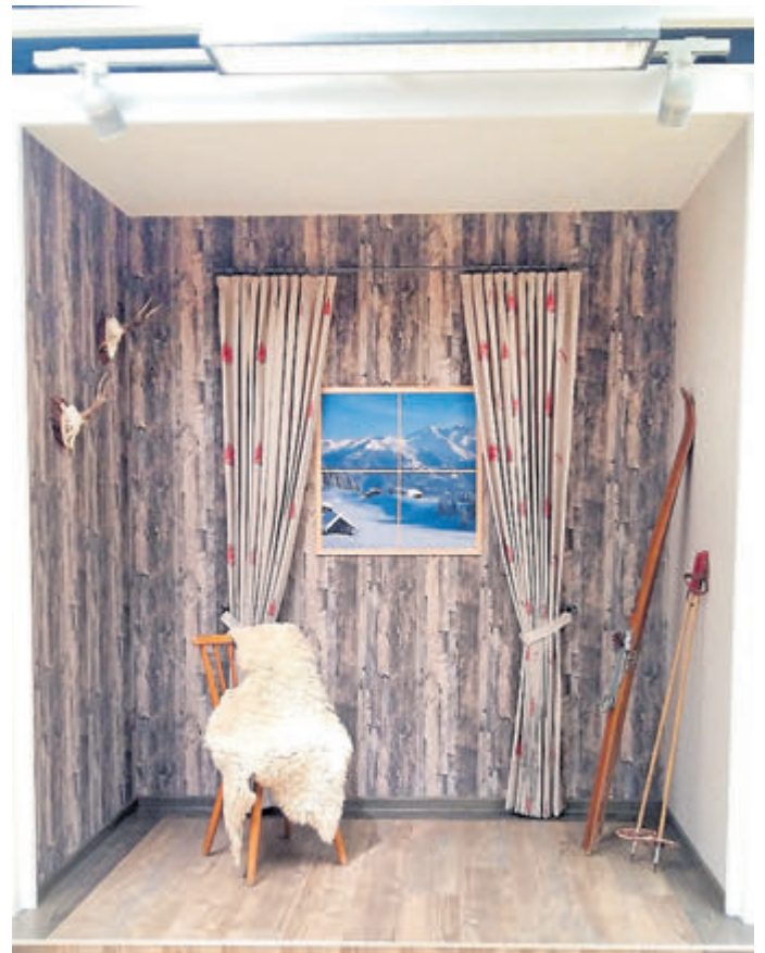
Die „Skihütte“ – das prämierte Gesellenstück von Samuel Knorr. Auf rund vier Quadratmeter galt es, einen Raum zu gestalten, mit Bodenbelag, Tapeten und selbstgenähten Vorhängen.

Weitere Informationen zur Ausbildung unter www.handwerk.de/berufsprofile/raumausstatter-in