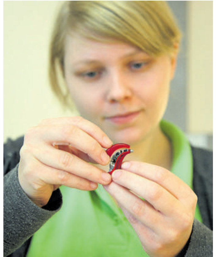
Ganz Ohr für die Bedürfnisse ihrer Kunden: Hörakustiker sind Techniker, Handwerker und Berater zugleich. Der Ausbildungsberuf aus dem Gesundheitshandwerk ist ebenso abwechslungsreich wie zukunftsfähig.