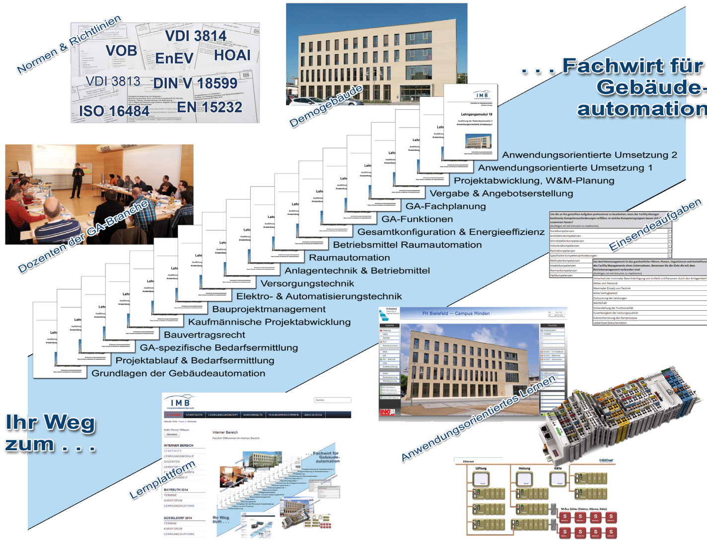
Die Konzeption wurde von der Universität Bayreuth und dem IMB-Institut erarbeitet.

Inhaltlich vorbereitet durch das Selbststudium begeben sich die Lehrgangsteilnehmer mit einheitlichem Wissensstand in den Präsenzunterricht (6 dreitägige Präsenzphasen mit je 3 Lehrgangsmodule). Wesentliche Punkte werden aufgegriffen und vertieft. Am Ende der Präsenzphasen erfolgen schriftliche Prüfungen. Die Präsenzphasen finden in der Handwerkskammer Reutlingen und einmal im Demogebäude Campus Minden (32427 Minden) statt.