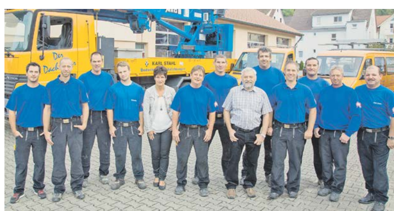
Die Belegschaft des Traditionsunternehmens.