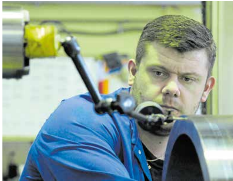
Für die Handwerksbetriebe sind Einkaufspreise und Energiekosten in den vergangenen Wochen weiter angestiegen.

Über alle Branchen hinweg meldeten 80 Prozent der Betriebe steigende Einkaufspreise, 16 Prozentpunkte mehr als im Vorjahr. Besonders drastisch fällt der Preisauftrieb im Bauhauptgewerbe (plus 37 Prozentpunkte), im Ausbauhandwerk (plus 23 Prozentpunkte) und bei den gewerblichen Zulieferern (plus 23 Prozentpunkte) aus. Dies dürfte sich schon bald in höheren Verkaufspreisen niederschlagen. Rund drei Viertel der Betriebe wollen ihre Preise in den nächsten Wochen anpassen. Vor zwölf Monaten lag dieser Anteil noch