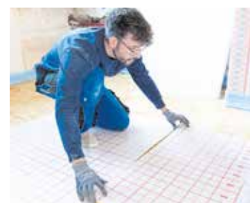
Die Bau- und Ausbaubetriebe verzeichnen landesweit das höchste Arbeitsvolumen pro Person.

Eine Ursache für die großen Branchenunterschiede ist die jeweilige Teilzeitquote. Die Pro-Kopf-Arbeitszeit ist umso höher, je geringer der Anteil der geringfügig Beschäftigten beziehungsweise der Erwerbstätigen in Teilzeit ist.