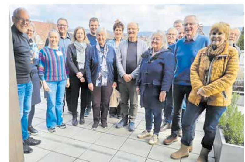
Senior Experten tauschten sich mit der Handwerkskammer aus.

Kontakt: Ute Pfeifer, Regionalkoordinatorin VerAplus – Region Neckar-Alb, Tel. 0163/4803131, E-Mail: neckar-alb@vera.ses-bonn.de